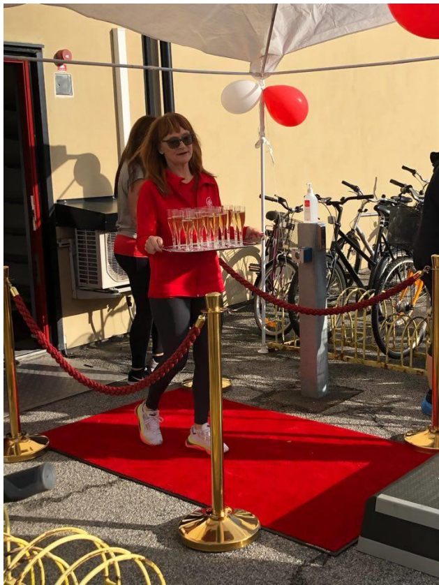
Ängen fest utan bubbel!