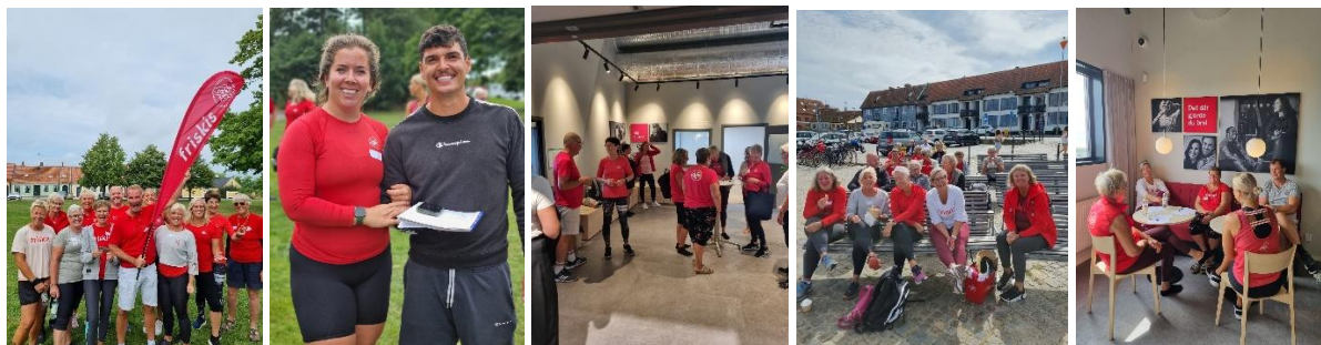
Funktionärerna i vår förening har en så värdefullt och genuint engagemang. Här lite bilder på inspirationsträffar som vi haft!

Vi har under året vidareutvecklat arbetet med "Funktionärsresan" och utvecklat arbetssätten med att boosta funktionärsengagemanget. Vi har erbjudit funktionärerna ett Check in-samtal, där vi möter upp varje funktionär för att lyssna in nuläget i engagemanget och med en blick framåt för vidare utveckling och motivation i uppdraget. Detta är en fortsättning på det som vi implementerade i funktionärssupports-arbetet under 2023.